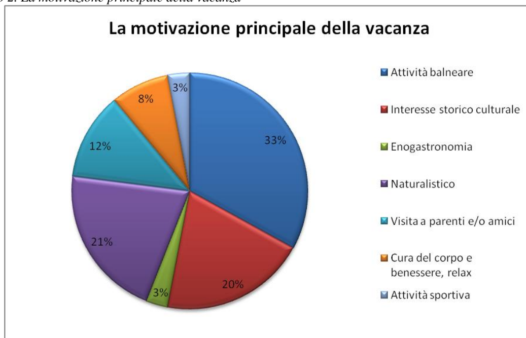
Grafico 2. La motivazione principale della vacanza

Per quanto riguarda gli strumenti di promozione e marketing dell'offerta turistica, la Basilicata risulta veicolata principalmente attraverso il passaparola: il 70% degli intervistati, infatti, dichiara di aver scelto la meta dell'attuale vacanza sulla base di consigli di parenti e amici, oppure per conoscenza personale. Appare evidente la scarsa rilevanza (11%) degli altri mezzi di promozione e commercializzazione turistica (agenzie di viaggio, stampa, fiere, TV e radio), anche se maggiore efficacia viene riconosciuta al Web (13%).