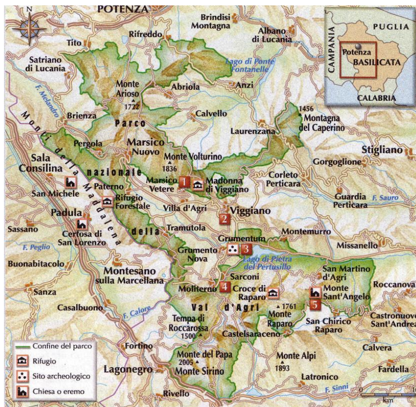
Figura 1: I confini del Parco Nazionale dell'Appennino Lucano

Il patrimonio naturale di quest'area è rappresentato da un lato da una flora e da una fauna di grande rilievo, dall'altro dal più vasto giacimento di petrolio dell'Europa continentale, la cui estrazione, avviata negli anni '30, è stata potenziata negli anni '80.