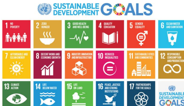
Figura 1 – I 17 Obiettivi di Sviluppo Sostenibile (SDGs) dell'Agenda 2030.

Per agire nelle cinque aree di azione prioritarie, l'Agenda individua 17 Obiettivi di sviluppo sostenibile (SDGs, si veda la Figura 1) e 169 target , fra loro integrati, indivisibili e declinati sulle tre dimensioni dello sviluppo sostenibile.