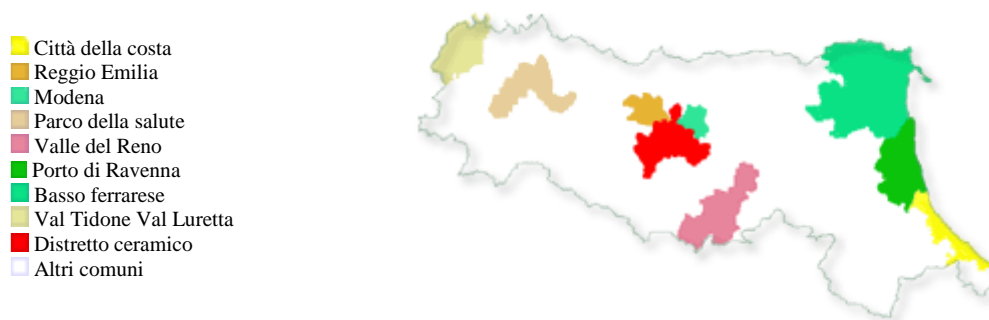
Figura 1 – Le aree dei programmi d’area di prima (DGR 538/97 e DGR 699/99) e seconda generazione (DGR 669/02) della Regione Emilia-Romagna