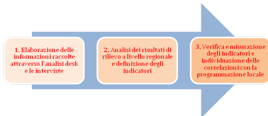
Figura 1 - Fasi dell'attività di valutazione

La prima fase di attività prevede l'analisi, attraverso l'esame dei documenti di progetto e l'intervista, del modo in cui si sono svolti i processi di costruzione e di attuazione/implementazione dei progetti. Il dialogo con gli interlocutori progettuali permette di cogliere gli aspetti motivazionali (cambiamento atteso), di verificare la situazione di partenza ( baseline ), di raccogliere elementi funzionali alla descrizione del progetto (attività, output) e alla verifica del cambiamento (risultati).