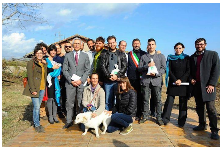
Figura 5 | Roma, Tenuta in terre pubbliche