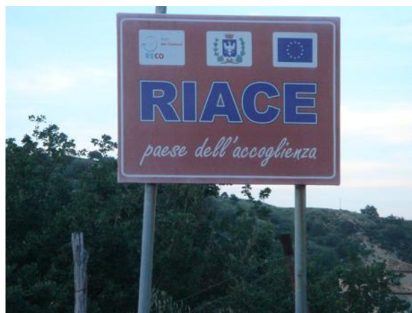
Figura 4 | Riace Paese dell'accoglienza.