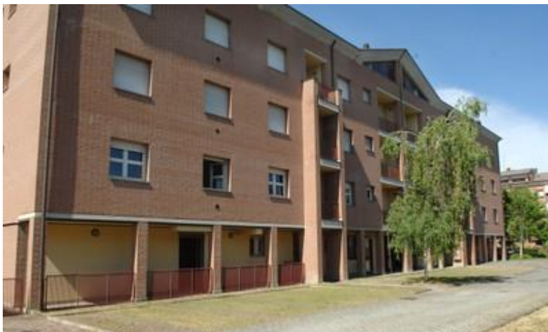
Figura 6 | Modena, Il Condominio solidale

Invece tutto ciò potrebbe essere coordinato nell'ambito dei Piani Regolatori Sociali (PRS) che prevedono un rapporto tra la richiesta specifica e l'offerta in ambito socio-sanitario. Di grande ausilio strumentale sarebbe l'impiego di tele-servizi, anche previsti nei PRS, sia ai fini medici che a quelli di evitare abusi od usi impropri di beni o spazi. In senso più ampio questo rientra nel tema del ripensamento delle parole "Comunità" e "Famiglia" come evidenziato nell'omologa Associazione: «Le Comunità di Famiglie sono una comunità di comunità, nel senso che la prima comunità considerata e oggetto specifico dell'Associazione è la famiglia, o una persona con il suo desiderio di famiglia che, riconoscendo di non bastare a se stessa, decide, per realizzarsi a pieno, di vivere accanto ad altri in modo solidale. La Comunità di Famiglie non si costituisce sulla fusione, ma sul vicinato solidale, non sulle norme, ma sulla fiducia reciproca.» (Mondo di Comunità e Famiglia).