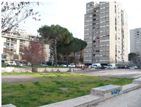
Figura 2 | Tor Bella Monaca, piazza Fonte: Stefano Aragona, 2015

lunghissimo edificio, pensata nel 2010 dall'allora Assessore regionale alla Casa Buontempo, ne chiese il risanamento a fini residenziali del IV e V piano ( http://arvalia.romatoday.it/corviale/corviale-no-abbattimento-protesta-regione-6agosto-2010.html ).