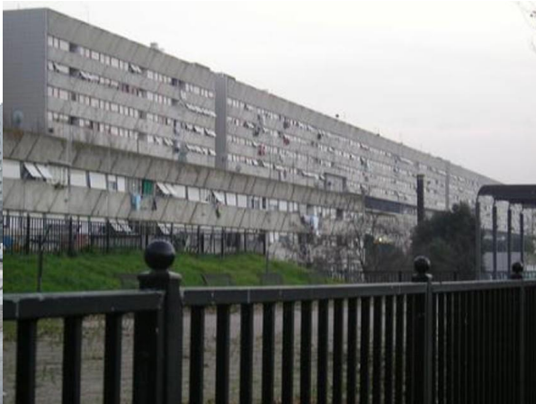
Figura 3 | Corviale l'edificio residenziale

Sono le principali città ad avere il “problema casa”. E tra esse le differenze che le caratterizzano si stanno forse acuendo. Tra lo ZEN e la citata Tor Bella Monaca appare una diversità nella qualità complessiva molto significativa. Ma non è questione, ancor più che negli altri casi, con cui si può confrontare la sola urbanistica. Attenzione che il riferimento sopra fatto alle dimensioni non è casuale. Nei piccoli e medi centri, cioè nella maggioranza delle realtà urbane italiane, la questione casa conferma abitudini, usi e modi tradizionali. Spesso associati al riuso, riqualificazione del patrimonio esistente.